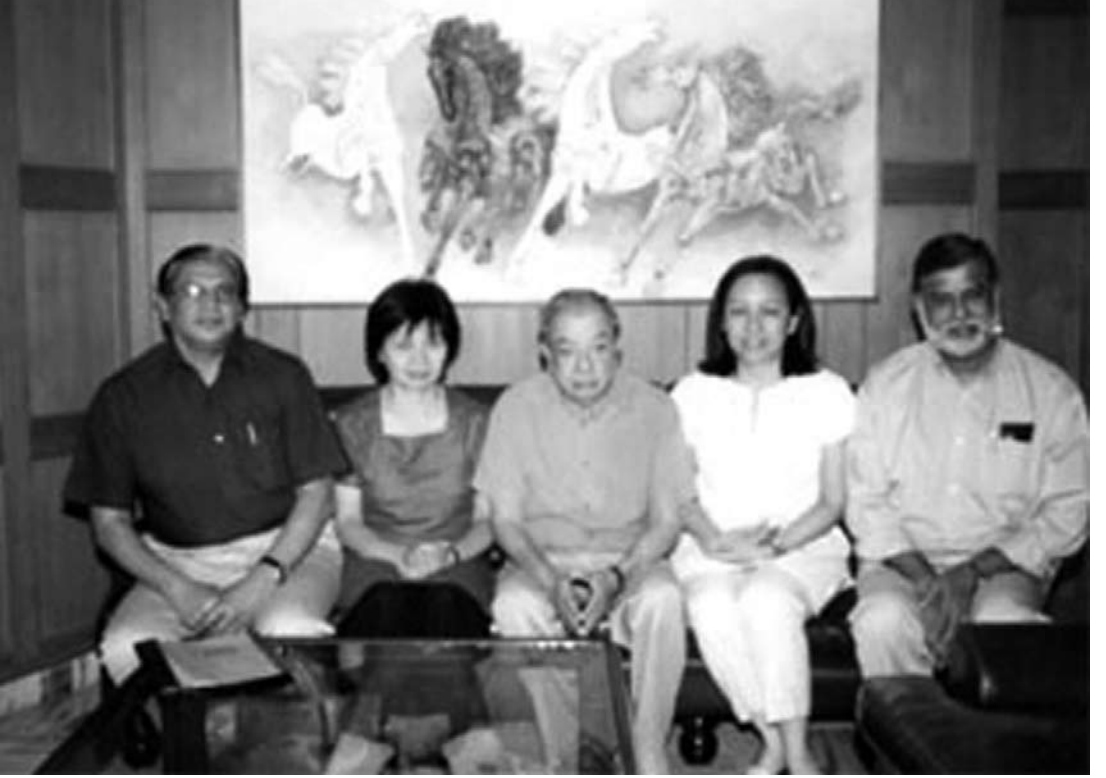
BM with Kurien and Guests

1964, after about two decades of its success! Give IRMA about 50 years and the world will see what you have done”. I continued, “In building IRMA you are catapulting the country ahead of this world by century or more. People will realise what you have done much after you and even I are gone.”